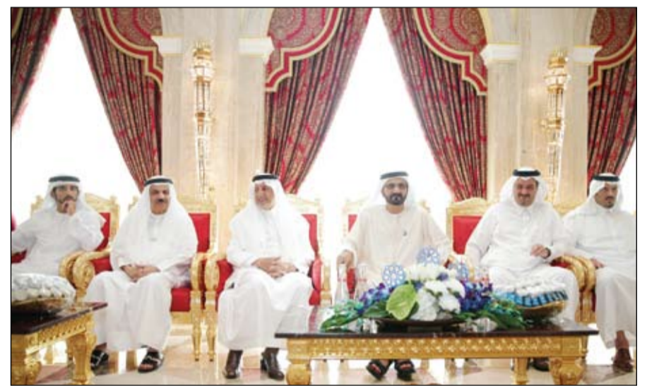
محمد بن راشد خلال استقباله الأمير خالد الفيصل

تلقي برقيات تهنئة من قادة دول عربية وإسلامية وصديقة بمناسبة اليوم الوطني والفوز باكسبو 2020 رئيس الدولة يتلقى دعوة من أمير الكويت لحضور القمة الخليجية •• أبوظبي-وام: تلقى صاحب السمو الشيخ خليفة بن زايد آل نهيان رئيس الدولة حفظه الله رسالة خطية من صاحب السمو الشيخ صباح الأحمد الجابر الصباح أمير دولة الكويت تتضمن دعوة سموه لحضور أعمال الدورة الرابعة والثلاثين للمجلس الأعلى لمجلس التعاون لدول الخليج العربية التي ستعقد في دولة الكويت خلال الفترة يومي 10 و 11 ديسمبر الحالي. تسلم الرسالة سمو الشيخ منصور بن زايد آل نهيان نائب رئيس مجلس الوزراء وزير شؤون الرئاسة من مبعوث أمير الكويت الشيخ علي جراح الصباح نائب وزير شؤون الديوان الأميري الكويتي خلال استقبال سموه له أمس بقصر الرئاسة. من جهة أخرى تلقت صاحب السمو الشيخ خليفة بن زايد آل نهيان رئيس الدولة حفظه الله مزيداً من برقيات التهنية بمناسبة اليوم الوطني الـ42 للدولة.