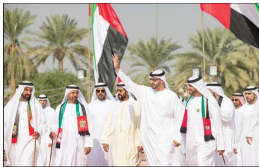
محمد بن زايد يشهد احتفالات قبيلة الأحباب باليوم الوطني (وام)

الاحتلال يصادق على بناء 3000 وحدة استيطانية بالصفة •• غزة-وام: صادق بوغي ياعلون وزير الأمن الإسرائيلي خلال الشهور الأربعة لتوليته منصبه.. على إقامة ثلاثة آلاف وحدة سكنية في المستوطنات الإسرائيلية في الضفة الغربية بما في ذلك المستوطنات المعزولة وخارج الكتل الاستيطانية. وقالت صحيفة هآرتس الإسرائيلية في عددها أمس إن ياعلون اضطر بناء على قانون حرية المعلومات تسليم معطيات رسمية في هذا المجال لحركة السلام الآن.. وبيّنت المعطيات أن ياعلون صادق خلال الفترة المذكورة حتى أواخر شهر يوليو الماضي على بناء 386 وحدة سكنية في مستوطنة بيت إيل كجزء من التعويض الذي قدمته الحكومة بعد هدم المباني التي أقمها مستوطنون في بيت إيل على أرض فلسطينية خاصة على جفعات هاو لبنا.. بجانب مصادقته على بناء 227 وحدة سكنية في مستوطنة كدوميم و550 وحدة سكنية في مستوطنة طالمون و849 وحدة في جفعات زئيف. وسرع خلال أربعة أشهر إجراءات بناء ثلاثة آلاف وحدة سكنية داخل المستوطنات وتوسيع منطقة نفوذ مستوطنة شيلما مما يمكن المستوطنة لاحقاً من بناء شقق إضافية. (تفاصيل أخرى ص11)